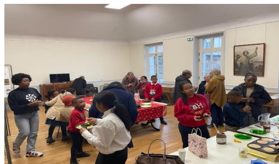
Culte de Noël suivi d'un goûter avec les enfants